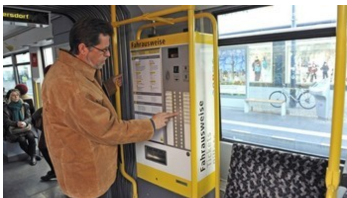
автомат в трамвае

Для детей от 6 до 14 — билеты по сниженной стоимости. Для детей младше 6 лет (на паромах — максимум 3 ребенка), детских колясок, собаки и багажа дополнительная оплата не требуется — взрослый с билетом провозит их бесплатно. Для поездок вместе с велосипедом существует специальный тариф.